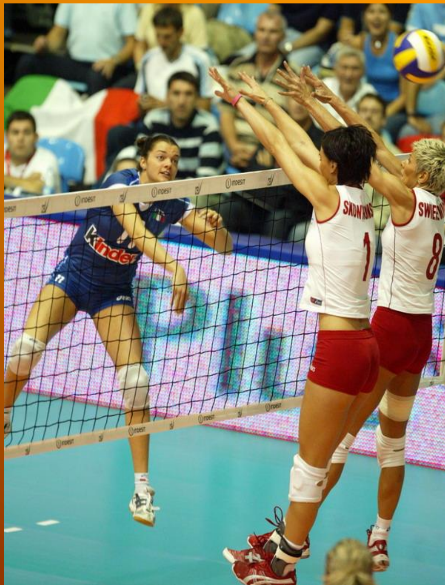
Slika 3. Dvojni blok