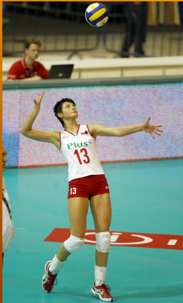
Slika 1. Servis