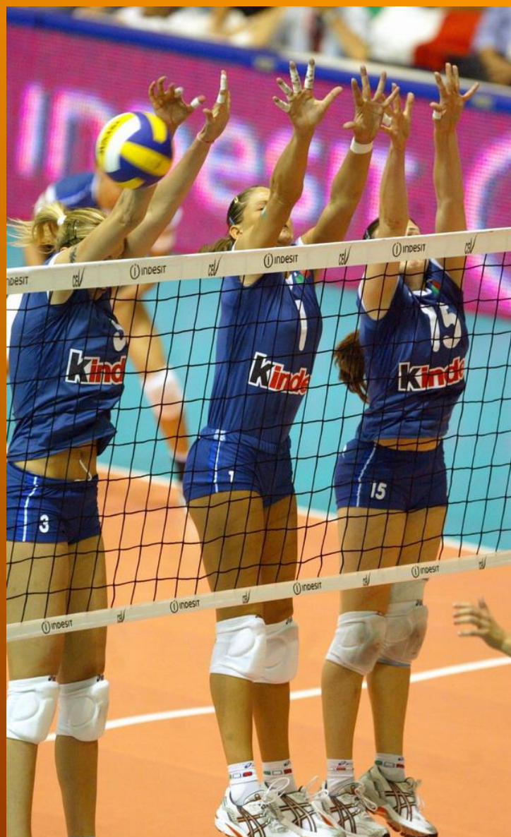
Slika 4. Trojni blok