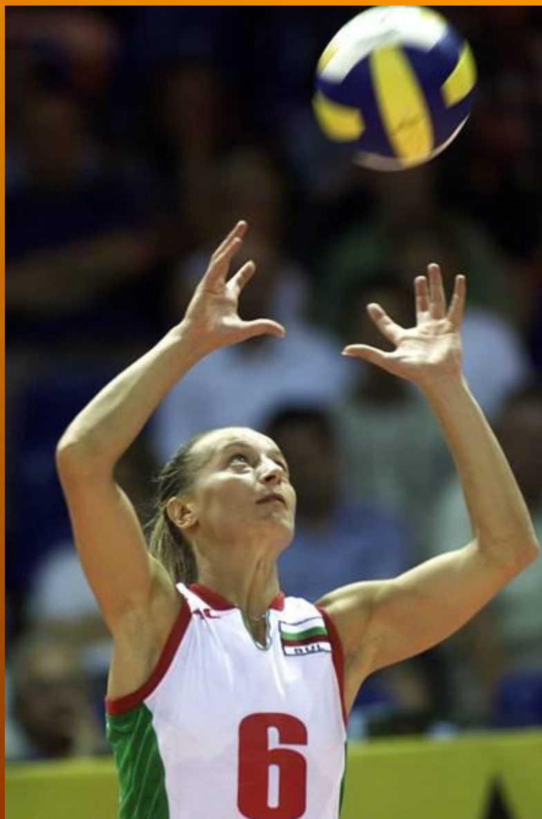
Slika 7. Dizanje lopte za napad