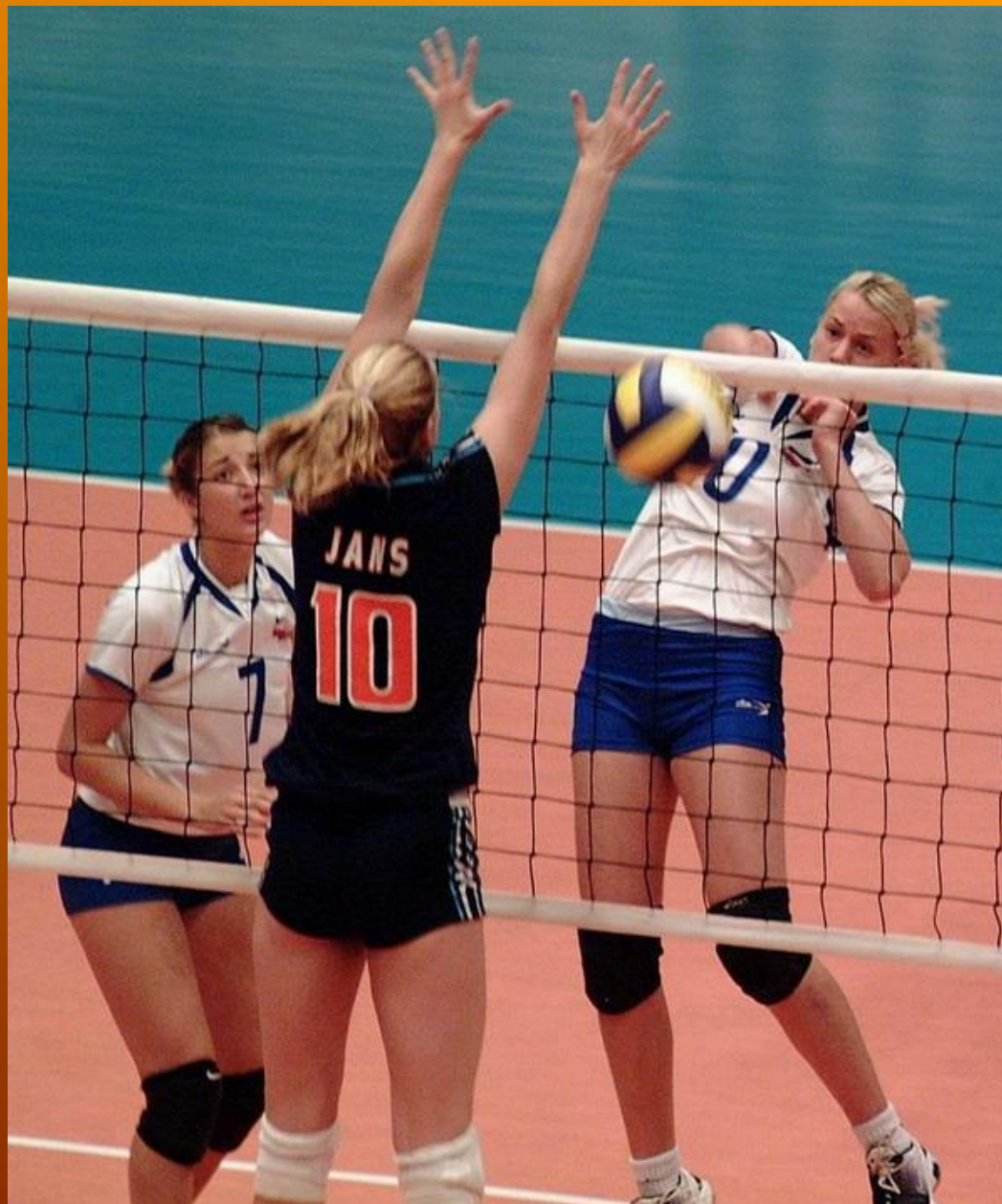
Slika 2. Individualni (jedinačni) blok