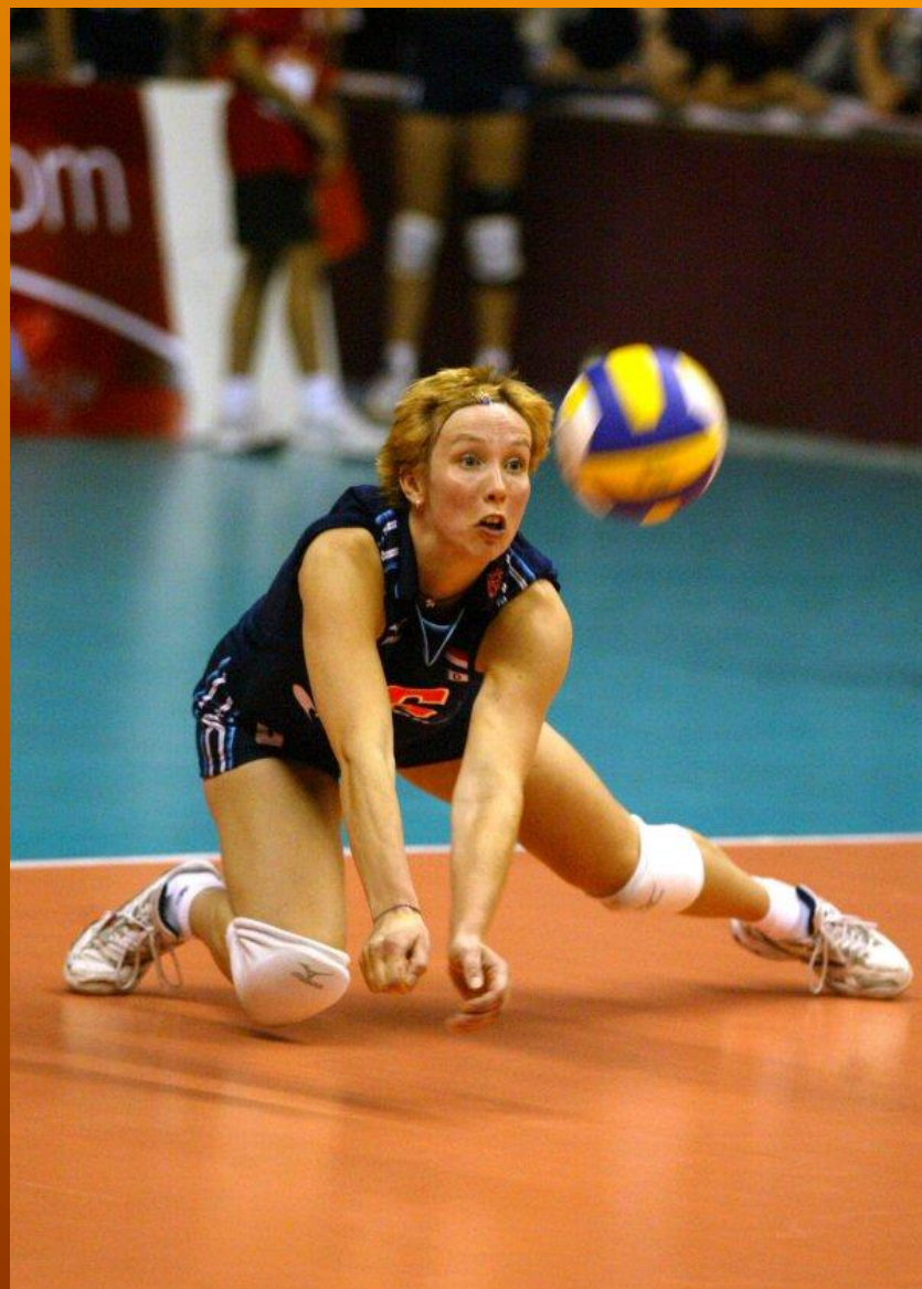
Slika 5. Odbrana polja